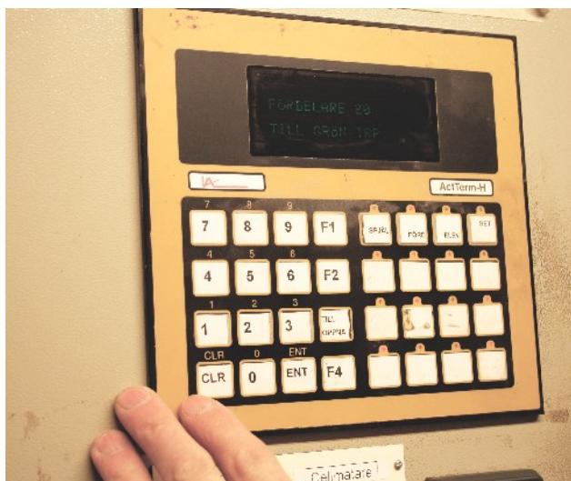
här ser man att rätt sak kommer i rätt fack