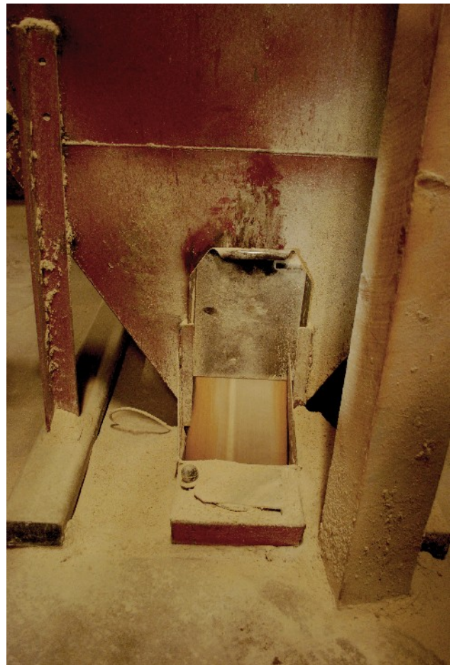
Här kommer sojan och premixen som skall till blandaren.

När det gäller svin så är blandningarna tämligen konstanta men när det kommer till nöt så ändras blandningarna över säsong hos varje bonde.